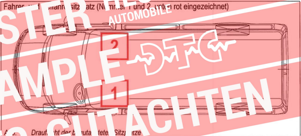
Abb. 1 Draufsicht der begutachteten Sitzplätze Tab. 1 Sitzplatzanordnung